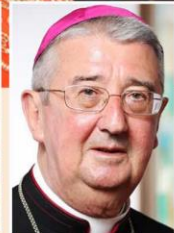
Most Reverend Diarmuid Martin (Archbishop of Dublin)